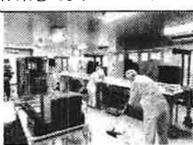
作業② 野菜のパッキング