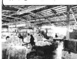
作業① クリーニング